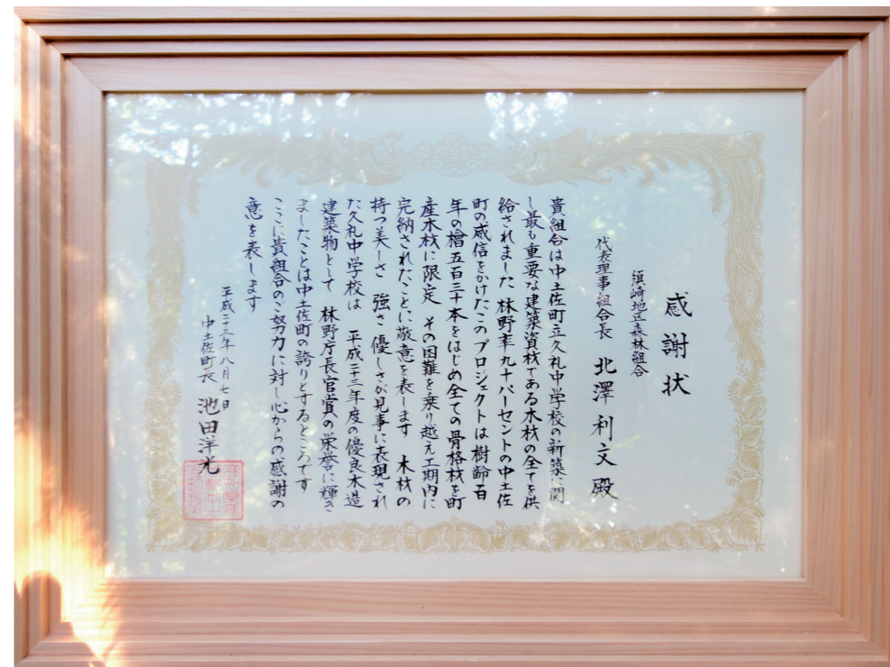
中土佐町よりいただいた感謝状。額縁は久礼中学校と同じ、中土佐町産の檜で作られています。

供給に関しては数々の困難がありました。森林所有者の方々、並びに関連業者の方々のご協力のおかげで無事、納期内に完納することができました。すべての方々に改めて御礼申し上げます。ありがとうございます。