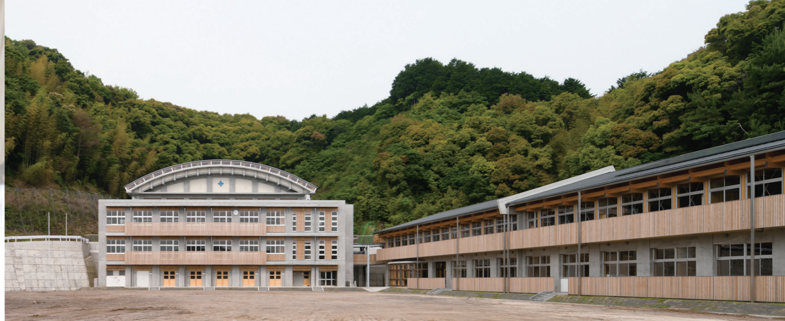
完成した久礼中学校。中土佐町産材により建築された中学校は、平成二十三年度の優良木造建築物として林野庁長官賞の栄光に輝きました。